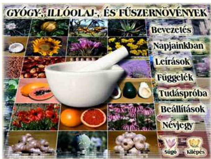
Főmenü – a program fő kezelőfelülete, innen érhetőek el a további ablakok.