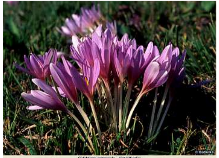
Colchicum autumnale - őszi kikerics őszi kikerics ( Colchicum autumnale )