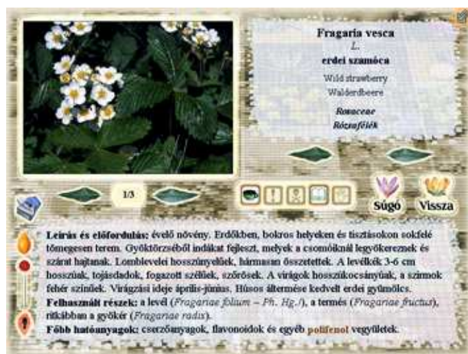
Adatlap – erdei szamóca ( Fragaria vesca )