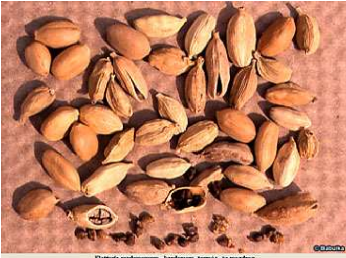
Elettaria cardamomum - kardamom, termés- és magdrog kardamom ( Elettaria cardamomum )