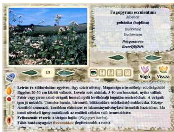
Adatlap – hajdina ( Fagopyrum esculentum )