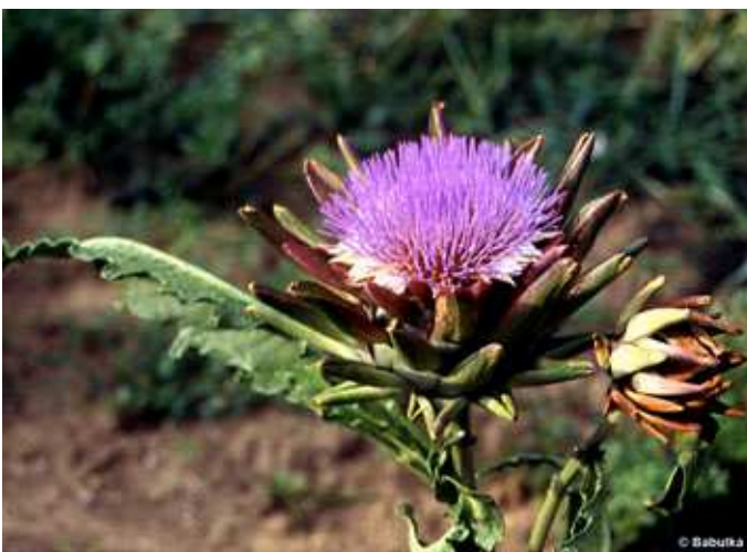
Cynara scolymus - articsóka articsóka ( Cynara scolymus )