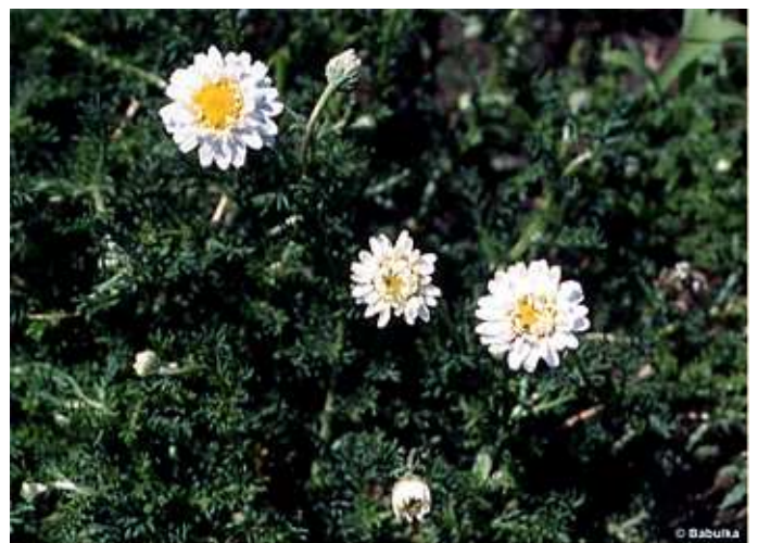
Chamaemelum nobile - római kamilla (rómszékfű) római kamilla ( Chamaemelum nobile )