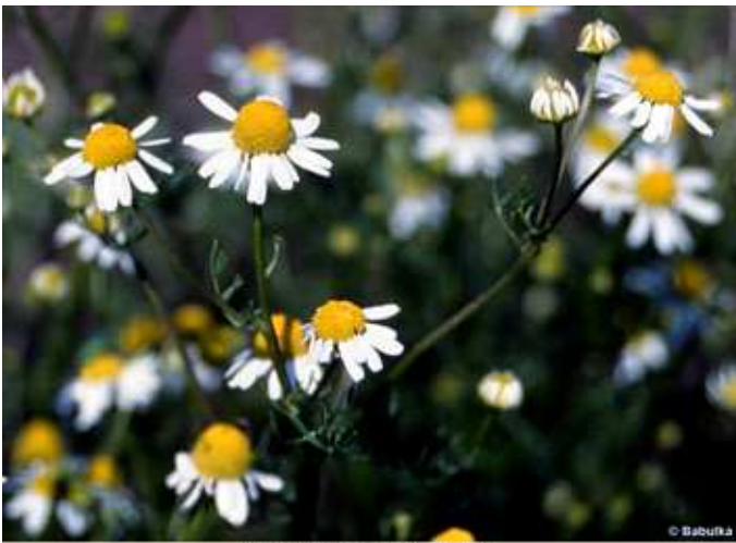
Matricaria recutita - orvosi székfű (kamilla) orvosi székfű / kamilla ( Matricaria recutita )