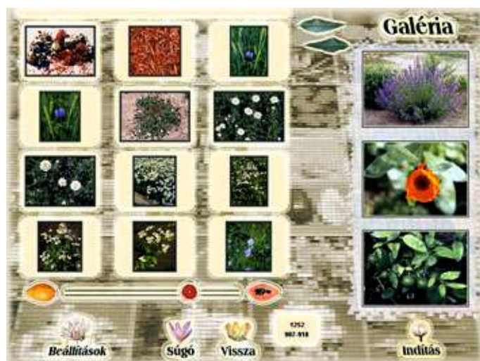
Galéria – tartalmazza a lemezen előforduló összes (1252 db) fotót. Saját diavetítés is összeállítható belőlük.