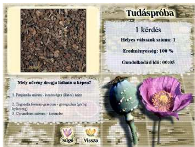
Tudáspróba – 20-20 kérdés a lemezen szereplő információkból.