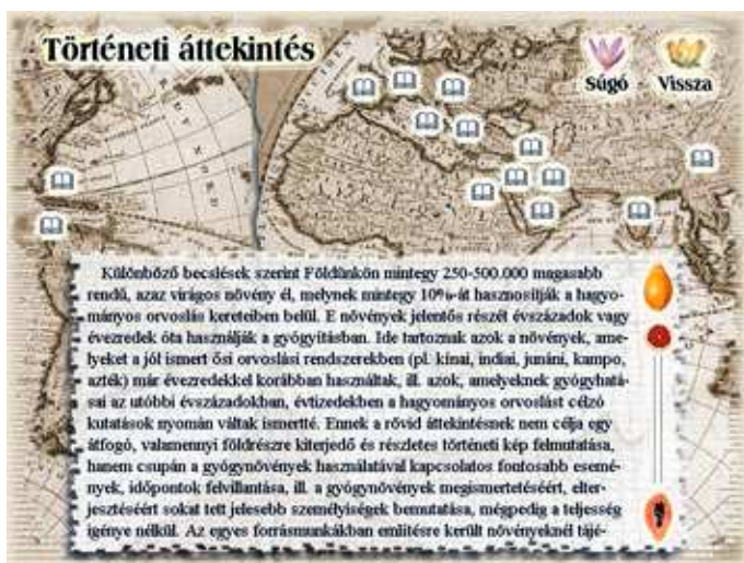
Történeti áttekintés – Írás a gyógynövények használatával kapcsolatos fontosabb eseményekről, az őskortól napjainkig.