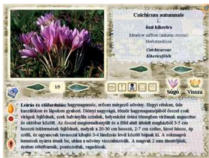
Adatlap – őszi kikerics ( Colchicum autumnale )