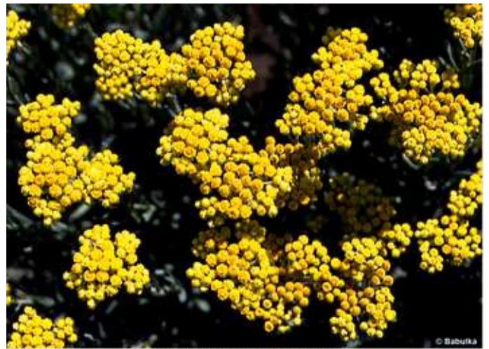
Helichrysum arenarium - homoki szalmagyopár homoki szalmagyopár ( Helichrysum arenarium )