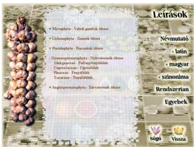
Latin vagy magyar névmutató, illetve szinonim nevek alapján...