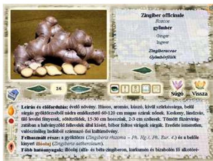
Adatlap – gyömbér ( Zingiber officinale )