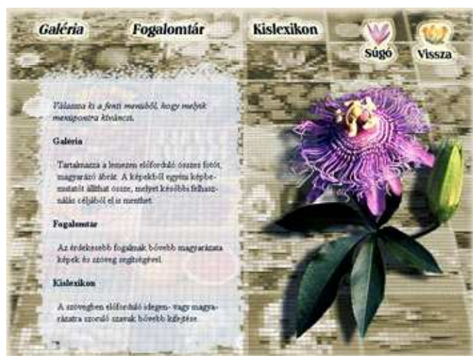
Függelék – Galériával, kislexikkonnal és a részletesebb magyarázatra szoruló fogalmak magyarázatával ( fogalomtár ).