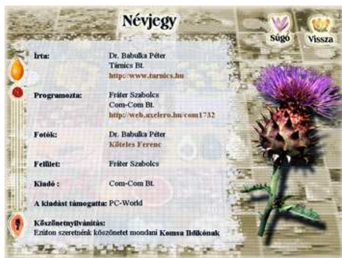
Névjegy – a szerzők felsorolása illetve a köszönetnyilvánítások.