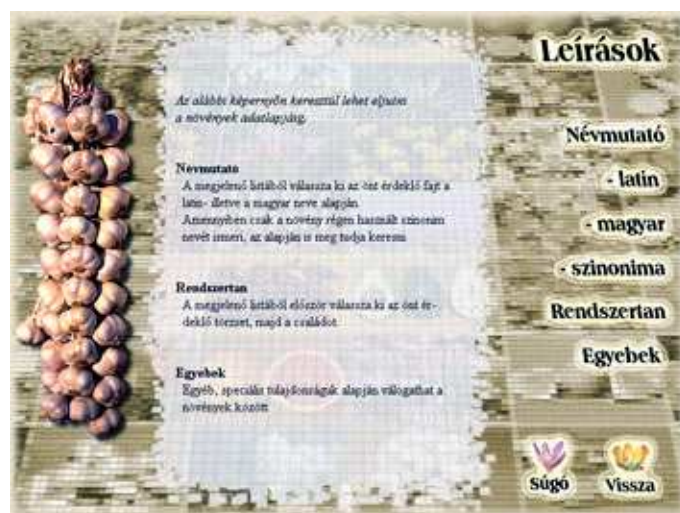
Rendszertani hovatartozás vagy kategória alapján...